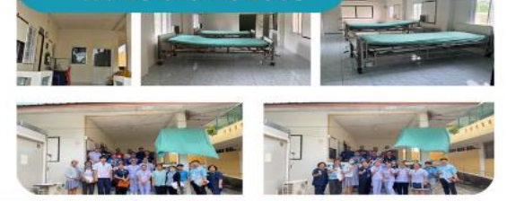
8. สว.ทุ่งฝน เปิด 20 มกราคม 2568