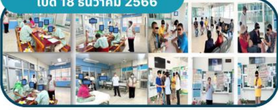
2. สว.กุดจับ เปิด 18 ธันวาคม 2566