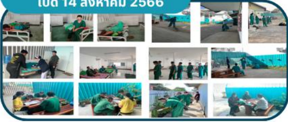
1. สว.วังสามหมอ เปิด 14 สิงหาคม 2566