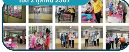
4. สว.หนองหาน เปิด 2 ตุลาคม 2567