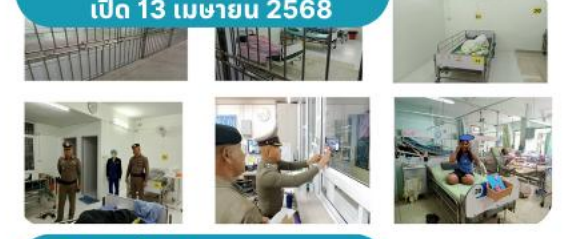
7. สว.หนองบัวซอ เปิด 13 เมษายน 2568