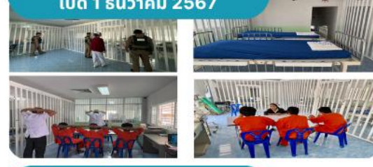
5. สว.โซยวาน เปิด 1 ธันวาคม 2567