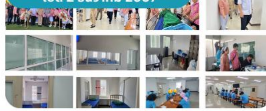
6. สว.เพี้ย เปิด 2 ธันวาคม 2567