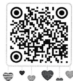
การใช้งานBiz.वाद/สปลา